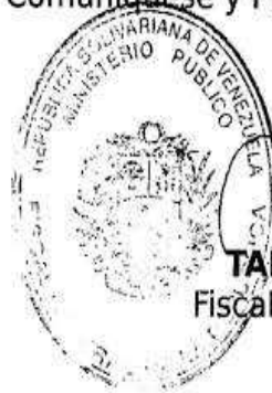
TAREK WILLIANS SAAB Fiscal General de la República